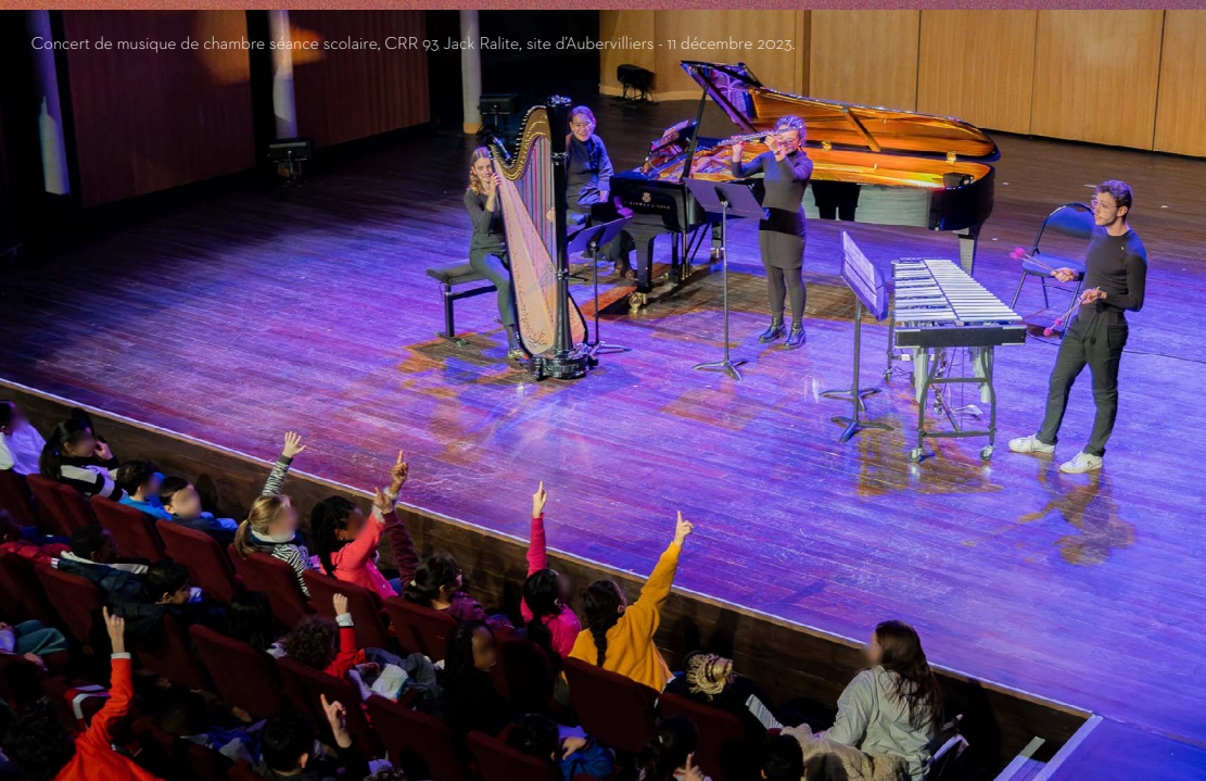
Concert de musique de chambre séance scolaire, CRR 93 Jack Ralite, site d'Aubervilliers - 11 décembre 2023.

Entrée libre dans la limite des places disponibles