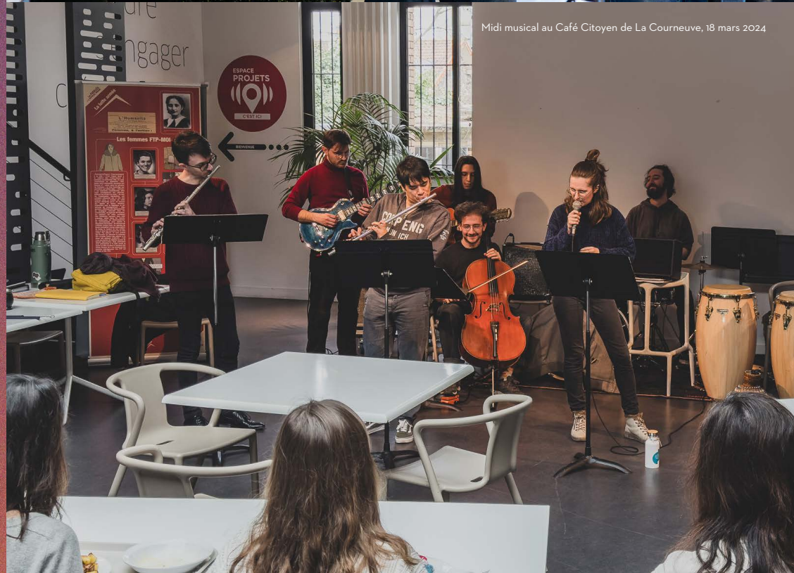
Midi musical au Café Citoyen de La Courneuve, 18 mars 2024