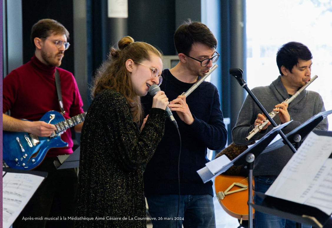
Après-midi musical à la Médiathèque Aimé Césaire de La Courneuve, 26 mars 2024

Entrée libre dans la limite des places disponibles