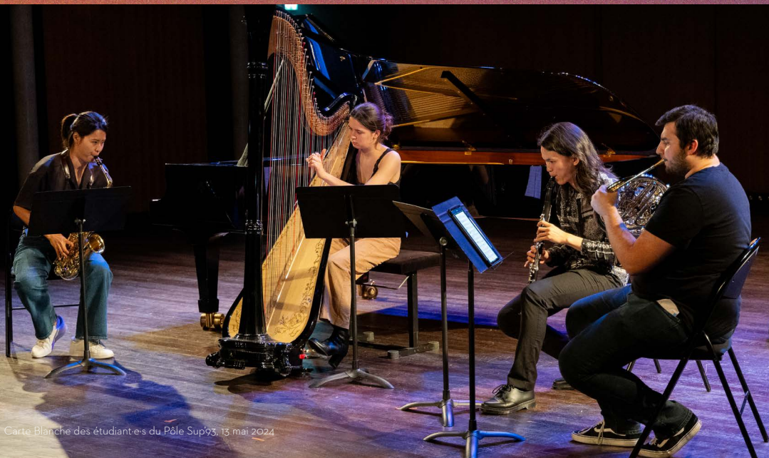
Carte Blanche des étudiant·e·s du Pôle Sup'93, 13 mai 2024